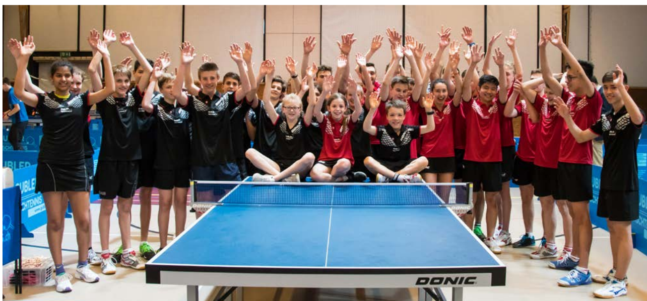
Teamgeist – STT Nachwuchskader 2016/17